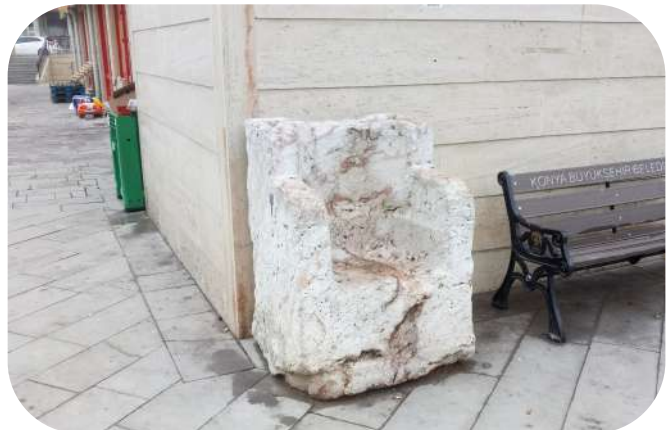
Kulu Bey Tahtı

K ulupoğlu Mustafa Bey adında bir aşiret beyi, 18. yüzyılın başlarında (1708 yılında) ailesi ve kendisine bağlı aşiret beyleri ile birlikte Afyon'dan gelerek şimdiki bulunduğu yere yerleşir. Bu yerleşim birimi, Kulupoğlu Mustafa Bey adından dolayı daha sonra Kulu olarak isimlendirilmiştir.