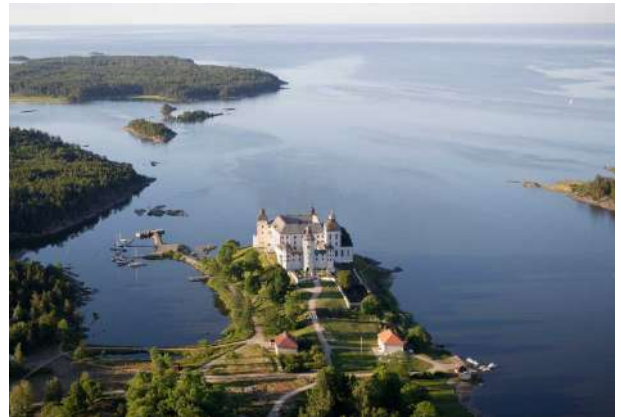
Vänern Gölü: Avrupa'nın üçüncü büyük gölü

Ülkenin yaklaşık olarak 1/10'unu kaplayan göllerin bazıları tektonik kökenli bazıları ise yer yer moren (buzultaş) yığınlarının gerisinde oluşmuş doğal set gölleridir.