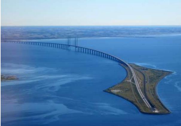
İsveç ile Danimarka'yı bağlayan Öresund Köprüsü

Uppsala: Ülkenin dinî başkentidir. 1477 yılında kurulan İskandinavya'daki en eski yüksek öğretim kurumu Uppsala Üniversitesi de buradadır.