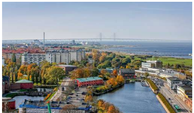
İsveç'in kültür şehri Malmö

**Ayrıca İsveç seçimleri için Kulu'da sandık kurulmaktadır.